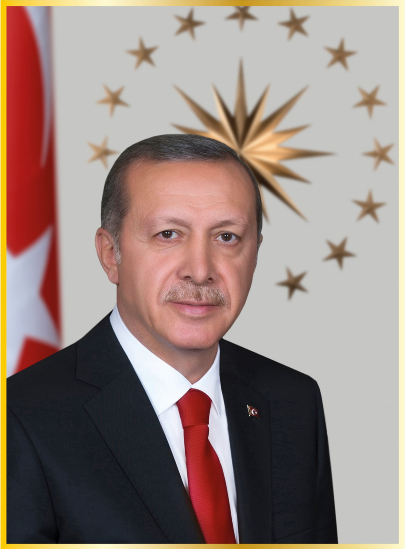
Recep Tayyip ERDOĞAN | Türkiye Cumhuriyeti Cumhurbaşkanı