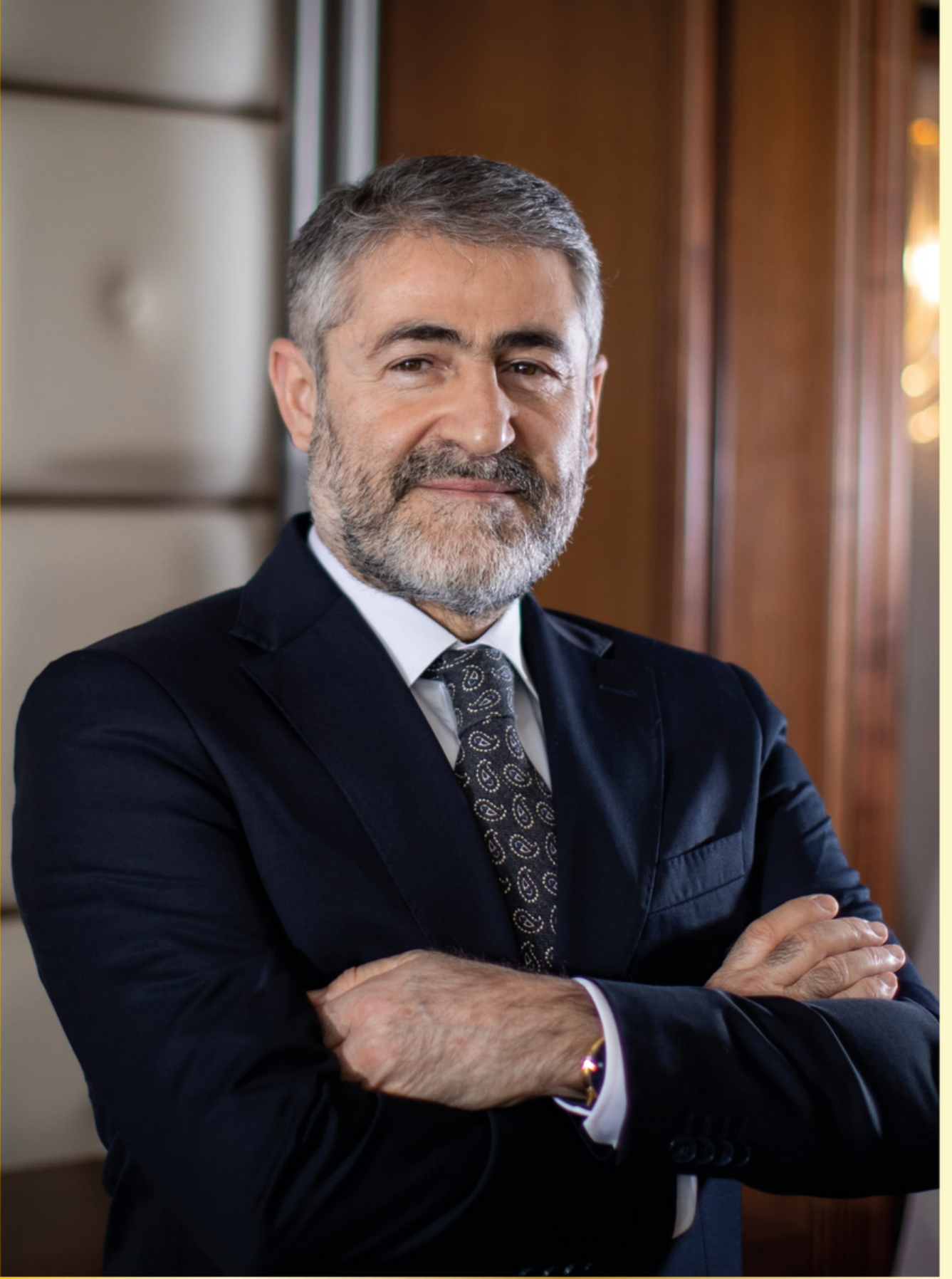
Dr. Nureddin NEBATİ | Hazine ve Maliye Bakanı