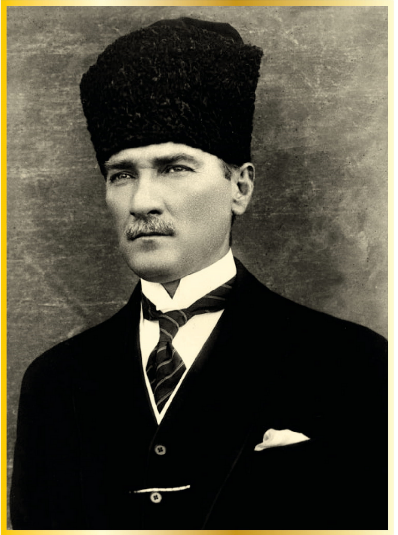
Gazi Mustafa Kemal ATATÜRK